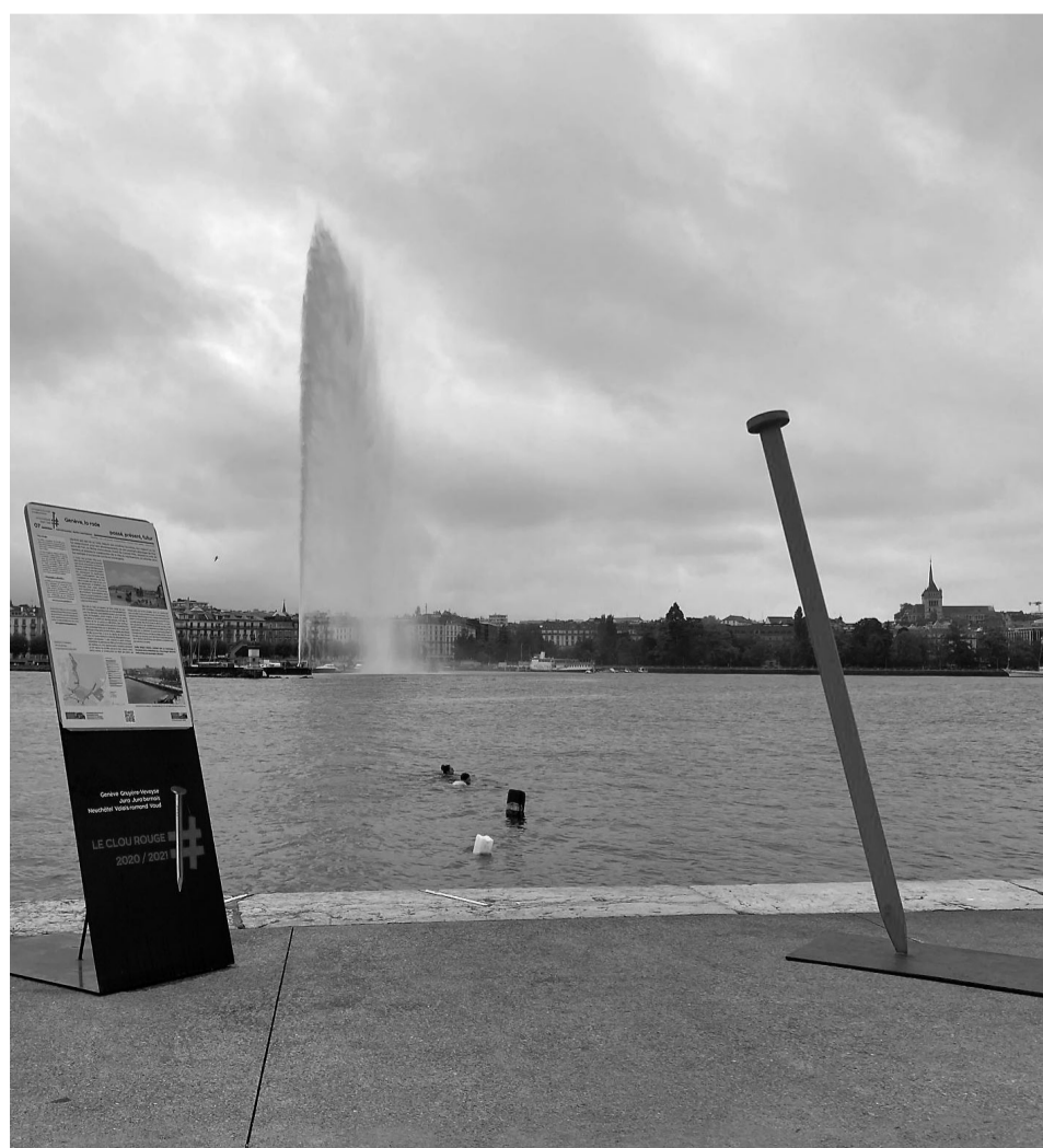
Le Clou rouge dans la rade.