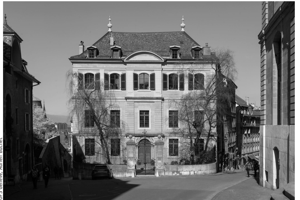
Façade principale de l'église luthérienne.